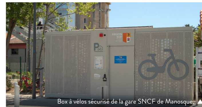
Box à vélos sécurisé de la gare SNCF de Manosque.