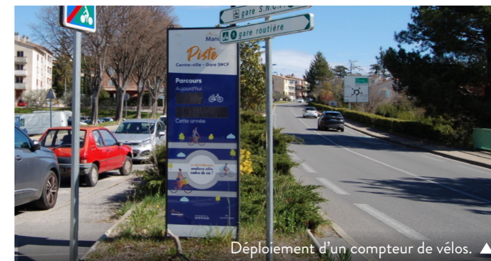
Déploiement d'un compteur de vélos.