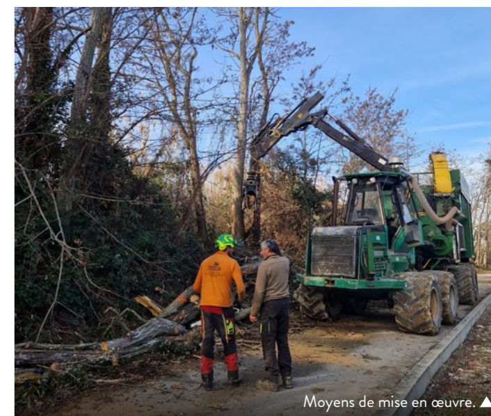
Moyens de mise en œuvre. ▲

DLVAgglo intervient ainsi sur les cours d'eau non domaniaux, dont le lit appartient aux propriétaires riverains et pour lesquels ils en ont normalement de devoir d'entretien (Art.L. 215-14 du Code de l'environnement). La Déclaration d'Intérêt Général (DIG) permet alors d'agir sur ces parcelles privées sans déposséder ces propriétaires de leur devoir d'entretien, mais au service de l'intérêt collectif en proposant une stratégie d'intervention cohérente à l'échelle des différents bassins versants.