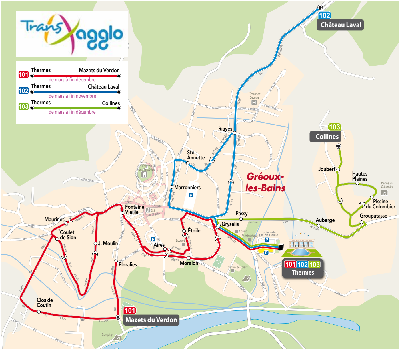
Plan de transport - Gréoux-les-Bains - Juillet 2019